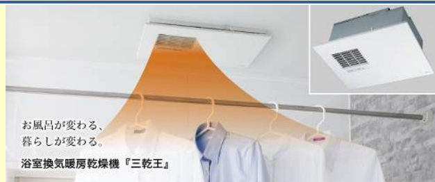
TOTO浴室換気暖房乾燥機『三乾王』

浴室事故による死者は交通事故の約4.5倍！ 厚生労働省の調査では、2014年の交通事故による死亡者4,113人に対し、浴室事故による死者数は推定19,000人(そのうち9割が65歳以上)と発表しています。