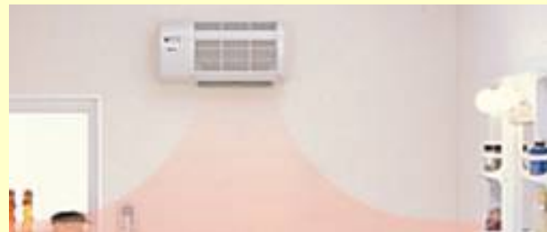
Rinnai 脱衣室暖房機 RBH-W312SNDT